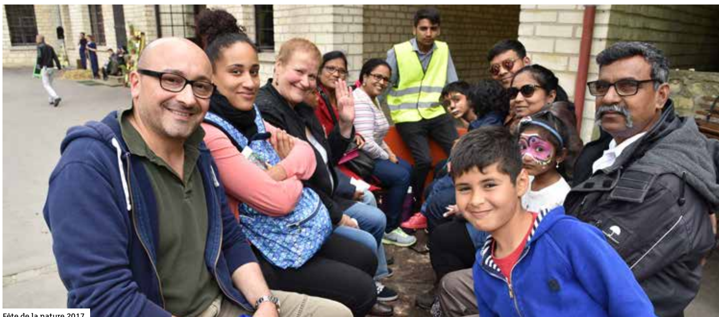
Fête de la nature 2017

Avec ses dix-huit hectares de terrains boisés, de prairies, et ses multiples bâtiments dont un ancien corps de fermé rénové, le domaine de Brécourt offre un potentiel exceptionnel où convergent l'ensemble des activités de la Frat' dans le Val-d'Oise.