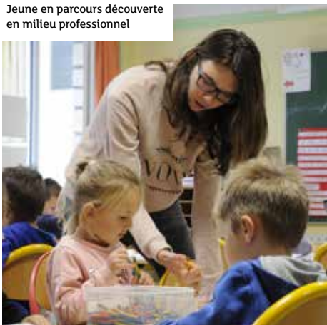
Jeune en parcours découverte en milieu professionnel

Le collège leur propose un parcours plus adapté et plus personnalisé, en petites classes de 15 élèves, avec un socle d'enseignement sur les matières fondamentales pour éviter le décrochage. Un parcours inscrit dans le cadre des Dispositifs d'Initiation aux Métiers en Alternance (DIMA). En complément, ils bénéficient d'un parcours de découverte professionnelle dans des entreprises et spécialités de leur choix. Les activités sportives et les ateliers de découverte occupent également une large place dans leur emploi du temps. Objectif : maintenir ces jeunes dans un cadre éducatif adapté qui les conduira en toute sécurité vers la filière d'apprentissage choisie, en disposant d'un socle de connaissances de qualité, validé par le Certificat de Formation Générale.