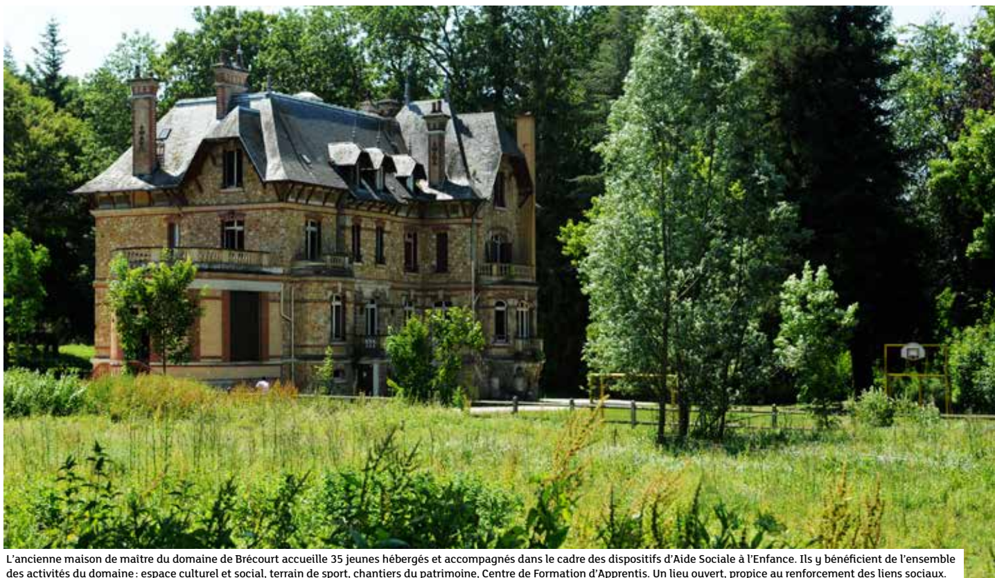
L'ancienne maison de maître du domaine de Brécourt accueille 35 jeunes hébergés et accompagnés dans le cadre des dispositifs d'Aide Sociale à l'Enfance. Ils y bénéficient de l'ensemble des activités du domaine : espace culturel et social, terrain de sport, chantiers du patrimoine, Centre de Formation d'Apprentis. Un lieu ouvert, propice au renforcement des liens sociaux.

+ 1 000 : C'est environ le nombre de jeunes de 0 à 21 ans actuellement suivis au titre de l'ASE dans le Val-d'Oise. Une mission assurée, comme dans l'ensemble des départements français par le Conseil départemental. Ces enfants et ces jeunes bénéficient soit de mesures de placement en famille ou structure d'accueil, soit d'une aide éducative, ou encore d'une prise en charge au titre des mineurs isolés étrangers. Dans ce cadre, la Fraternité Saint-Jean accueille 35 jeunes dans son internat éducatif « La Grande maison », au cœur du domaine de Brécourt à Labbeville. « C'est leur maison et nous faisons en sorte qu'ils puissent s'y épanouir, autour de projets,