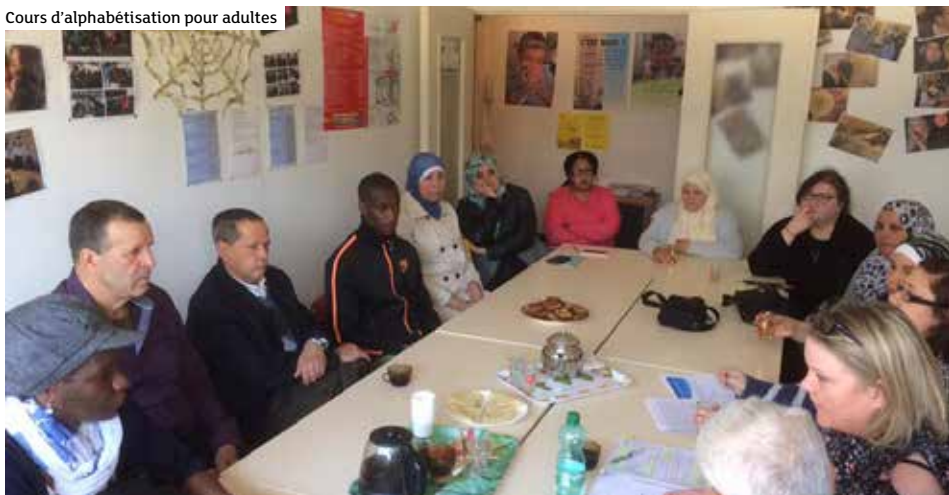
Cours d'alphabétisation pour adultes