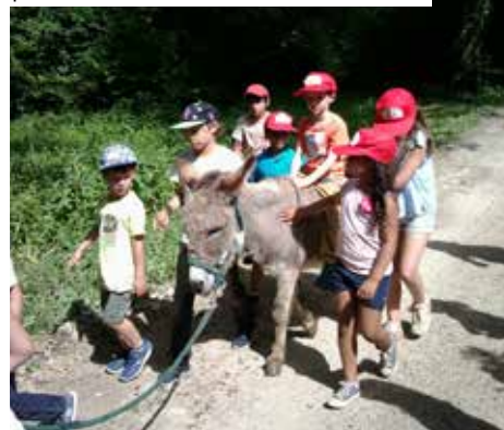
Sortie nature dans le parc du domaine de Brécourt pour les enfants des communes du Vexin