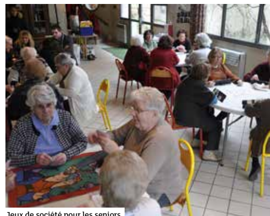
Jeux de société pour les seniors