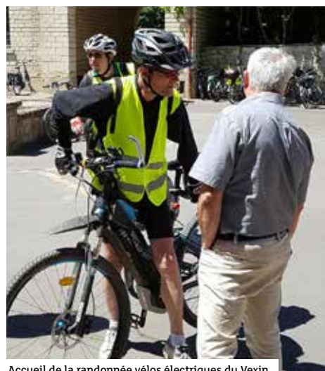
Accueil de la randonnée vélos électriques du Vexin

Le site de Brécourt est idéalement situé pour accueillir un centre culturel et social qui réponde pleinement aux attentes exprimées par les habitants des communes rurales de la vallée du Sausseron. ”